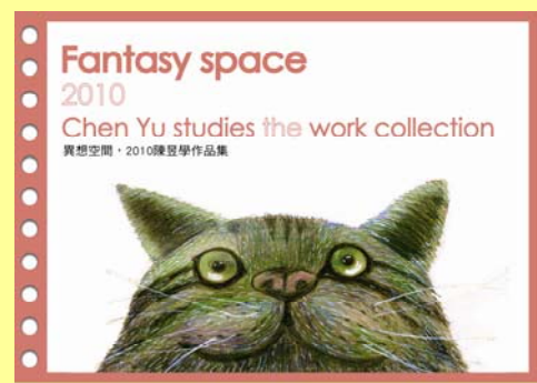
昱學在校設計作品

我也要呼籲所有的特教生，請不要自憐自艾覺得贏不了同儕，自己一定要去努力專研自己的興趣與專長，如果當初我沒有認真的準備也不可能考上醫學院。因為那所學校，學測的成績至少要 70 級分才能念(總分也才 75 級分)，是我們學校第一名也不可能念得到的學校，而考上的學生也都是前五志願第三類組的高中生，所以對自己一定要有信心，才可以邁入勝利的殿堂，老師們也不要看輕特教學生，我們的潛力是無窮的，只要您能像我的貴人老師們，一樣的認真培育我們，也可以教出優秀出色的學生。