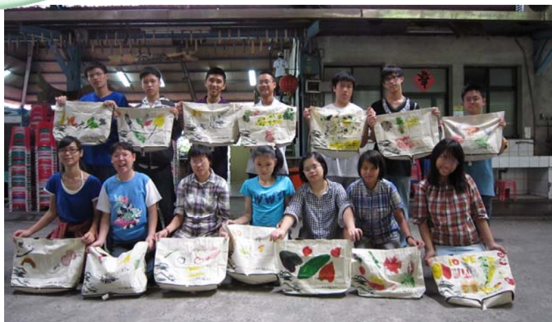
頭城農場校外教學