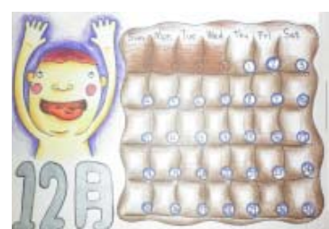
特教桌曆比賽佳作【廣設科 223 李品興、曾蘭心作品】