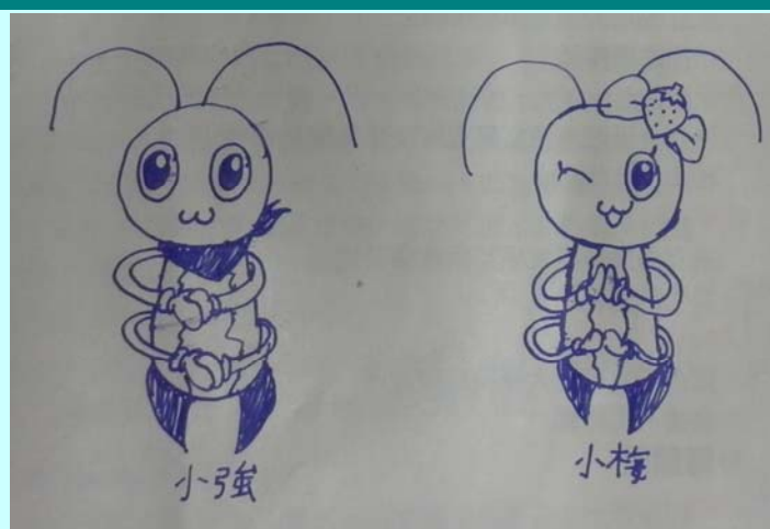
廣設科 323 高健騰作品~可愛的小強與小梅