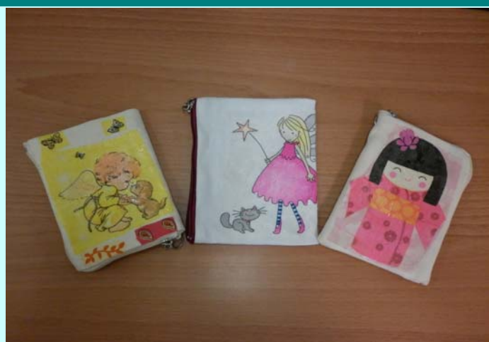
綜職科學生作品~蝶古巴特拼貼手機袋