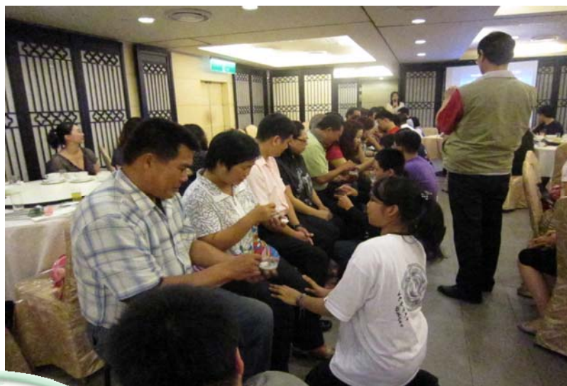
畢業感恩餐會~感謝親恩