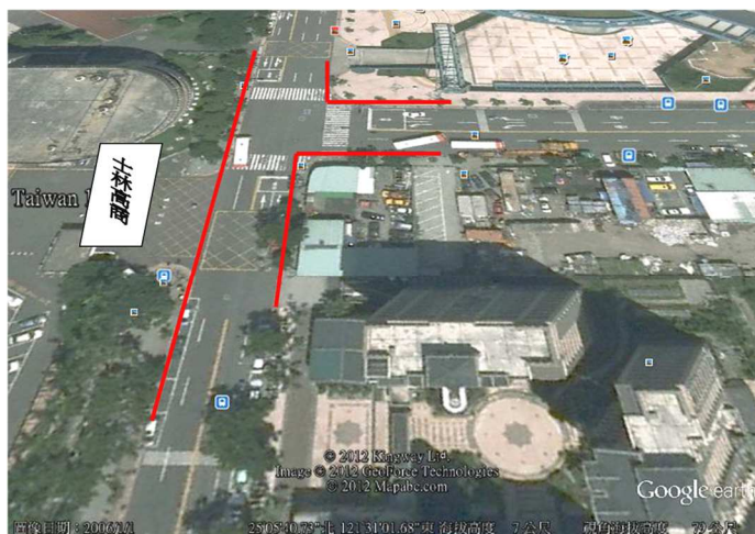
為紅線及公車站區域-禁止臨時停車

請騎車及開車接送的家長配合,讓同學由右方車門上下車;校門口之紅線及公車站請勿臨時停車,亦請勿在門口違規迴轉,以免影響後面來車,造成交通壅塞。