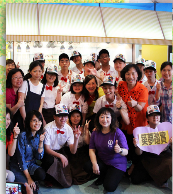
綜職科愛心義賣活動 ▲