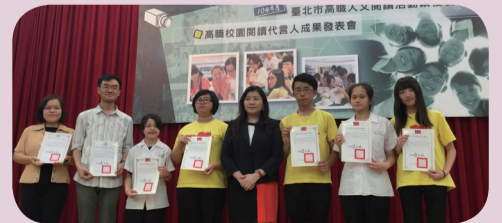
●本校榮獲104年臺北市高職 人文閱讀活動卓閱學校獎