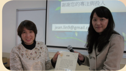
輔導主任頒發感謝狀以茲感謝