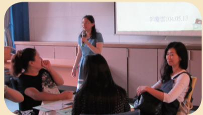
讀書會--講師導讀「晚熟世代」