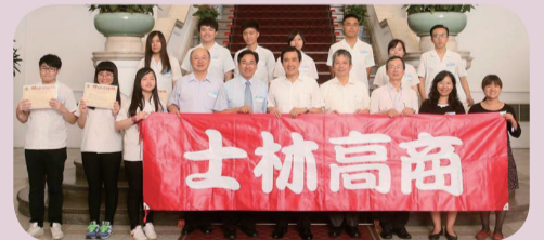
●本校榮獲 2015 國際學校 網界博覽會第一名