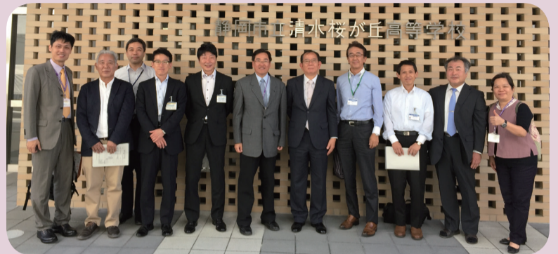
●校長與日本清水櫻丘高校師長合影