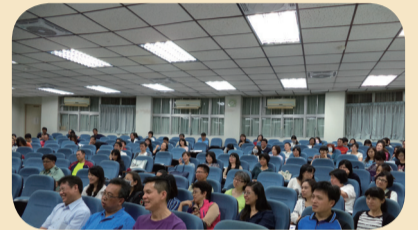
全校教師專心聆聽毒品危機及教師輔導管教策略