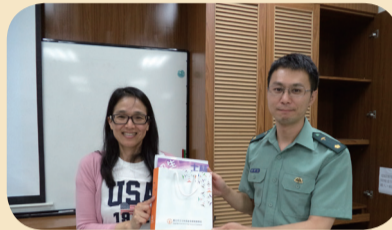
輔導室與教官室聯合辦理教師輔導研習