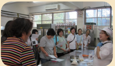
烘焙課程--家長分組合作自己動手做