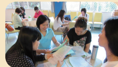
講師使用短片幫助家長了解青少年心理特徵