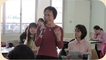
分享任務成功之方法--了解對方需求