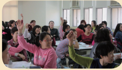
在活動中扮演子女角色的夥伴成員