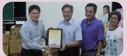
●士商募書送愛心--校長與內城國中 校長及本校家長會會長、教師會長合影