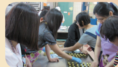
家長們在製作過程亦互相分享教養經驗/互相認識