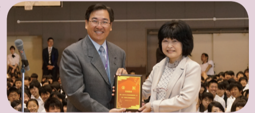
●校長與日本沼津商業高校校長合影