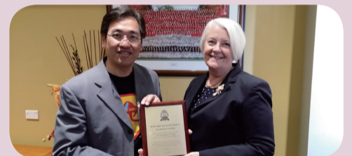
●校長和澳洲聖約翰校長合影