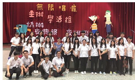
音樂觀摩賽亞軍-夜106▲

因為這場比賽，使得原本陌生的我們變得更有團結心！即使不是第一名，但是這份感動，我們將銘記在心！