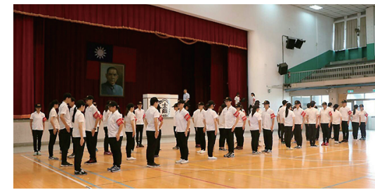
秩序服務隊幹部合影▲

來到這裡，是一個全新的挑戰！當能堅持下去，跨越的會是自己從沒想過的新境界。如果不做，永遠不會知道自己會因來過這裡而有什麼改變，但假如決心做了，一定會有所成長！最後，希望秩服能夠往更好的方向邁進，謝謝願意為服務隊付出努力的同學們！