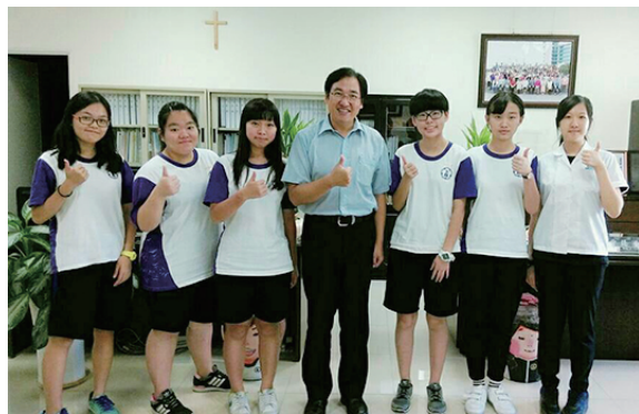
校長與編輯社社員合影 ▲

祝福每位士商學生都能快樂學習、找到未來，也祝福每位老師皆能享受教學成就，桃李滿天下。祝福我們士商欣欣向榮，成為技職教育的典範學校！