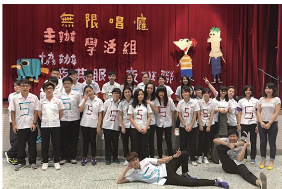
音樂觀摩賽冠軍-夜105▲