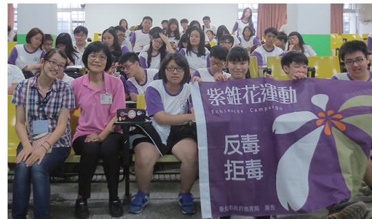
反毒講座的師長與同學合影▲

透過這類活動的宣導不僅讓我們了解毒品的危害，也能明白往後遇到毒品該如何拒絕，更可藉此幫助更多人遠離毒害，縱使出社會也記得在校時期便樹立於心中的反毒精神。此良好的推動結果即為「紫錐花運動」該社團成員之期望與推廣的動力，同時也希望其他學生們也能多多支持本運動，協助打擊毒害，使我們的生活更好。