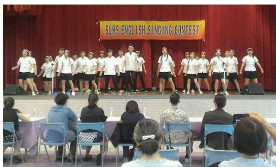
英語歌唱比賽冠軍-219▲

成功並不是一天、兩天就可以達到的，大家利用放學時間留下來練習，舞蹈也是一步接著一步慢慢練習而成，這場比賽的過程中，或許不是完全順利，但是當成績公布的那一剎那，所有的努力都值得了。