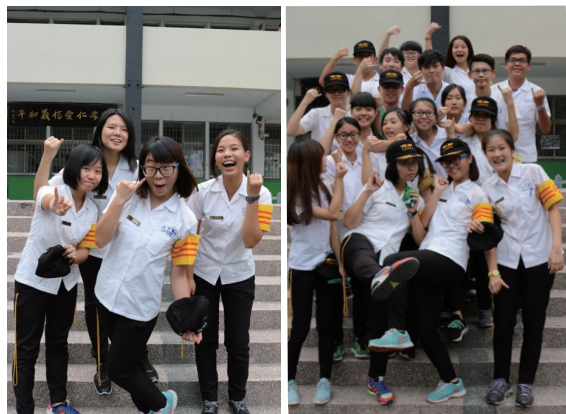
交通服務隊幹部合影▲

當上大隊長後，覺得壓力變大了，面對的問題也比當初階幹部時多了很多！目前還沒有遇到什麼太大的困難，也希望將來可以一一克服所有挑戰。雖然我可能不算是一個很棒的大隊長，但是我會努力做到最好！如果有做不好的地方也歡迎各位指教，也請各位多多包涵。