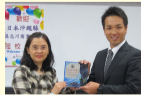
教務主任和具志川高校帶隊師長互贈紀念品