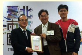
本校榮獲北市教育局105年閱讀推手獎