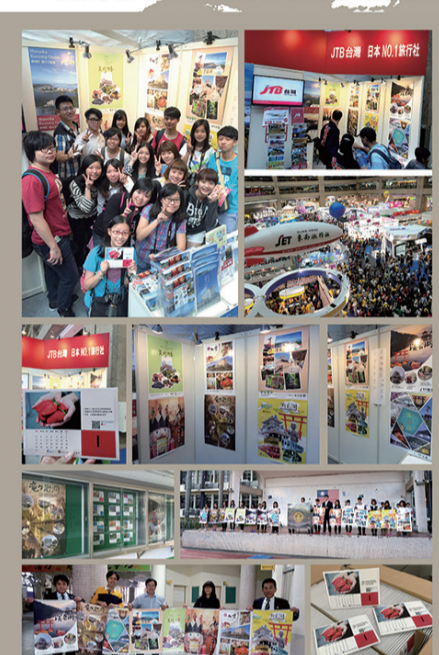
本校承辦臺北市104年度日本商業設計實習及文化見學團學生作品在台北世貿國際旅展及日本靜岡濱松及東北秋田攤位展出