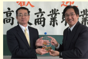
校長和鹿兒島高校校長合影