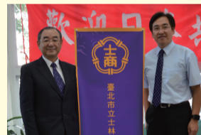
校長和共愛學園校長合影