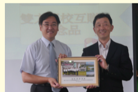
校長和沼津高校校長合影