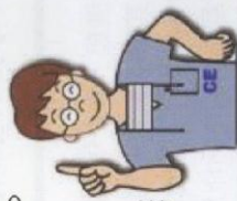
正常菸與K菸 K菸的擺放方式