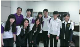
編輯社同學與校長合影