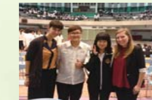
編輯學校與評審合影