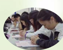
教友同學為己祝禱加油!