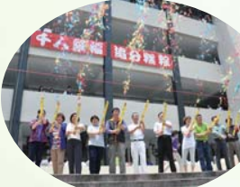
千人祈福禮炮祝禱

在士商每間教室、每個角落都有我們的足跡，之後就要分道揚鑣了，心中充滿了不捨，但即使以後的道路未必相同，你我也都曾經歷這美好歲月，只要心緊緊地繫在一起，相信情誼並不會因為時間而沖淡的，美好回憶會永存心底，天下沒有不散的筵席，這不是旅途的終點，而是另一個旅途的開始。