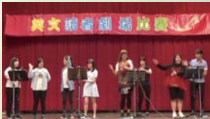
獲修學校206班比賽剪影