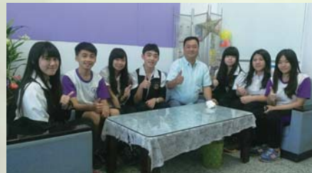
編輯社同學與家長會盧會長合影

105年士商家長會仍將大力協助學校推動校務，搭起家長與學校之間友善溝通的橋樑，並為家長們解決學生與師長間的問題，另外也會致力於家長會志工隊的發展，盼能穩定成長及革新。 本學期舉辦「包粽粽活動」已圓滿落幕，非常感謝各處室的協助及辦理，同時也希望高二的學生能夠金榜題名，考上理想的學校！ 會長對於本屆畢業生有高度期許，特別希望能注重品德教育的學習、擁有謙遜的態度與堅持不懈的精神，記住機會永遠是留給準備好的人!共勉之。