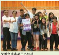
榮獲全北市第三名佳績

夜206班代表本校參加台北市104學年度高職學生英語讀者劇場比賽，榮獲全北市第三名佳績，再次恭喜獲獎班級。