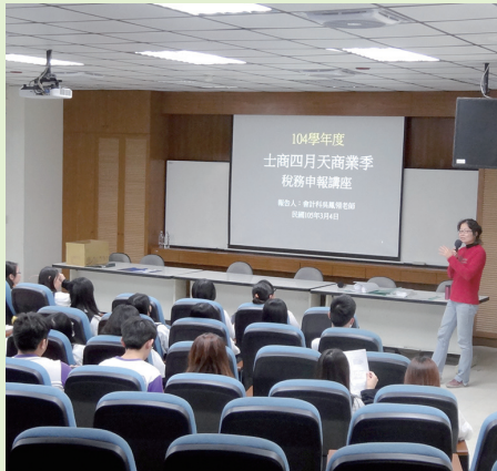
舉辦稅務申報講座。