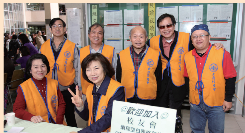
士商的傳統：商業季，讓許多的校友能在這如此特別的節日裡，相聚在一起，再次重返士商生活。校友會會長：「昨日你以士商為榮，今日士商以你為榮。」