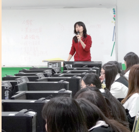
舉辦財務報表講座。