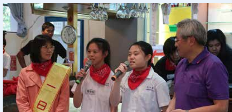
每年商業季，綜職科同學都會在地中海餐廳舉辦義賣活動，由特教班二年級同學負責製作所有的義賣商品，除了可增加烘焙實習機會，所得款項也捐作本校愛心便當專款，以做公益來呼應友善校園。感謝教育局蔡實督學擔任一日店長，以及愛心不落人後的綜職科師生，還有士商家長會、校友會與各屆善心人士的共襄盛舉