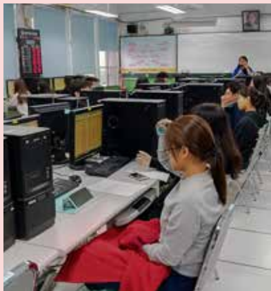
■以擬真的方式，運用多媒體系統教導學生如何進行設立登記，讓學生清楚瞭解設立登記相關注意事項與流程，使所學理論與實務結合。