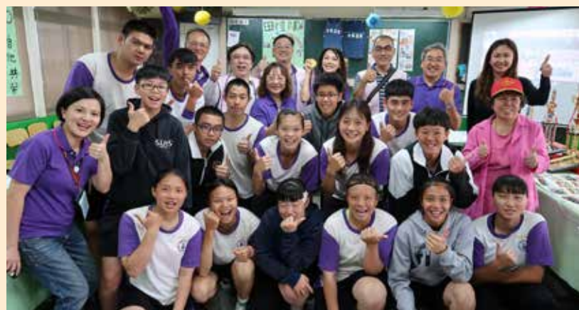
體育班今年度改以競賽成果展、體適能檢測與體能遊戲活動做為商業季展示，推廣健康強身並展現豐碩的競賽優異表現