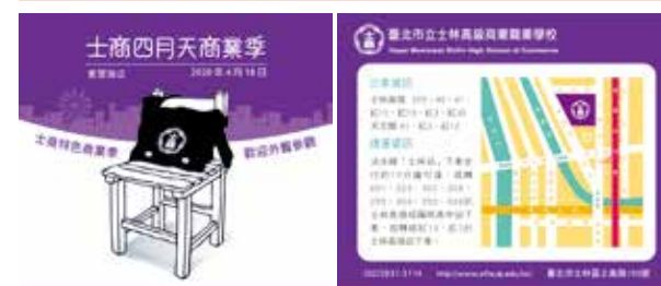
由廣設科設計的宣傳面紙，是廣設科學以致用的一個代表。