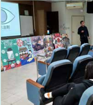
■廣設科教師以視覺觀察的心裡開始講解實習商店海報設計與店面布置的實用技巧，讓非設計本科同學也能做出具水準的作品。