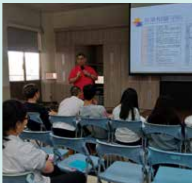
■透過營業計劃講座，讓學生能充分運用所學於實際執行層面，並將其概念化完整地呈現於計畫書上，內容包含目標設定、執行步驟以及成果的評估，使學生能將實務層面的知識有架構且有系統的方式進行規劃。